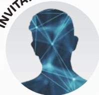
Invitat Special Ministerul Muncii și Solidarității Sociale